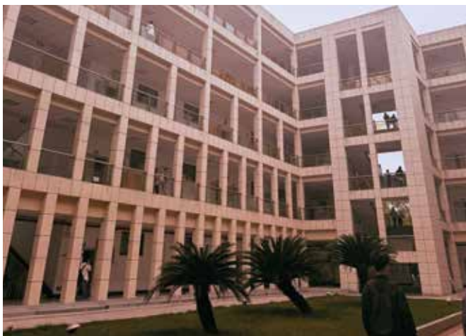
■ Die University of Technology in Wuhan