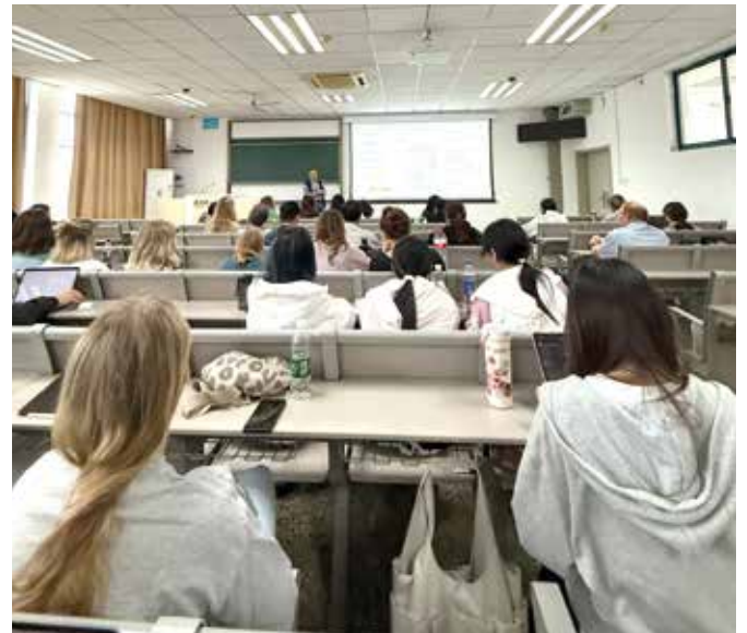
■ Im Vorlesungssaal