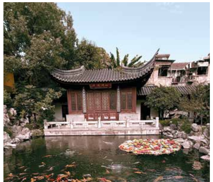
■ Parkanlage in Shanghai