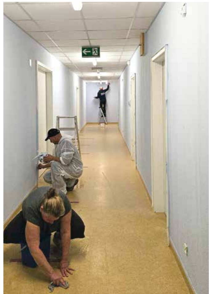
■ Nur noch die Klebereste und Farbkleckser entfernen und die Arbeit ist erledigt.