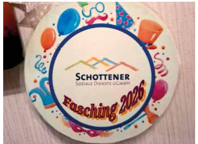
■ Der „Schottener“ Faschingsorden