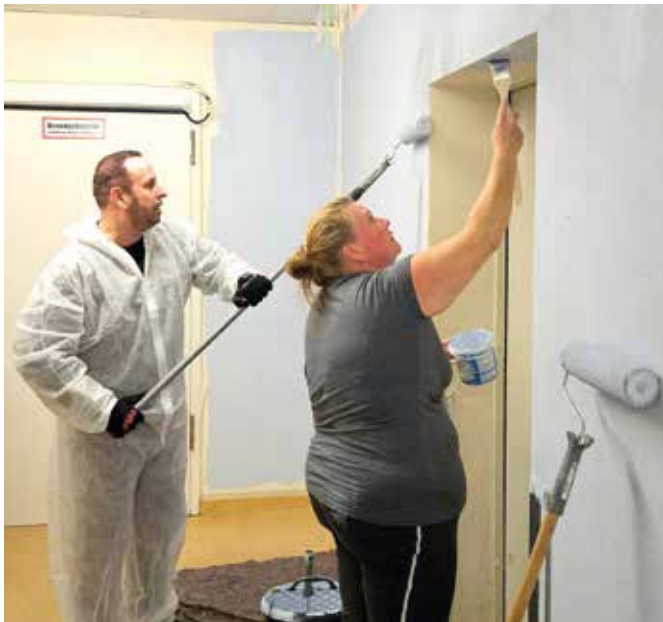
■ Und dann wurde eifrig gerollt und gestrichen...