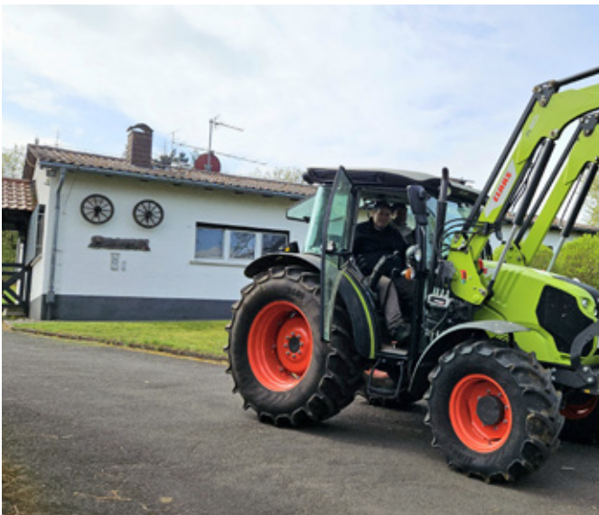
■ Vorne starke Maschinenpower, im Hintergrund das Bürogebäude vom Lindenhof.