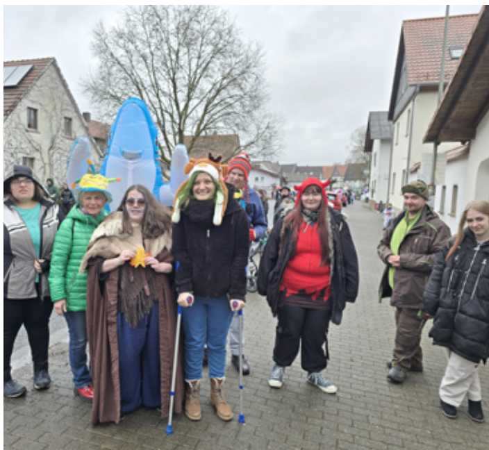
■ Genauso bunt wie der Umzug: die „Schottener“ in Freieenseen

Trotz des trübten Wetters versammelten sich zahlreiche närrische Zuschauer*innen am Umzugsrand und sorgten mit