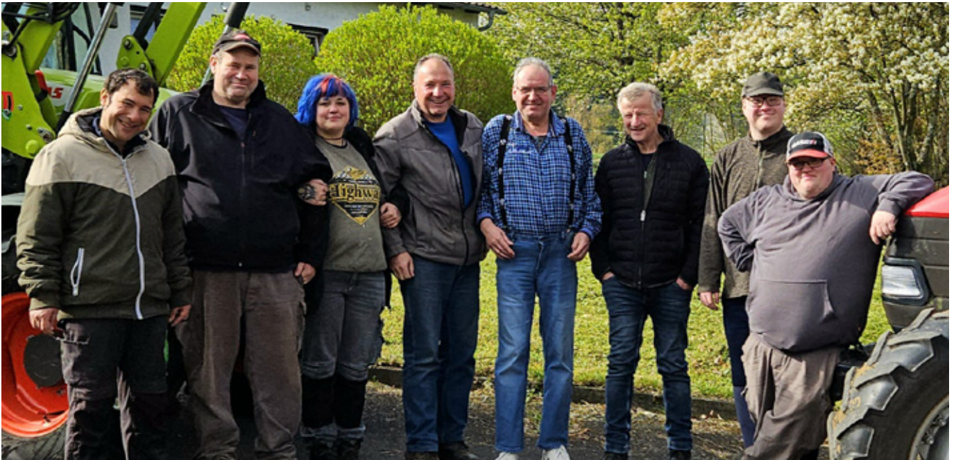
■ Ein Teil des Lindenhof-Teams