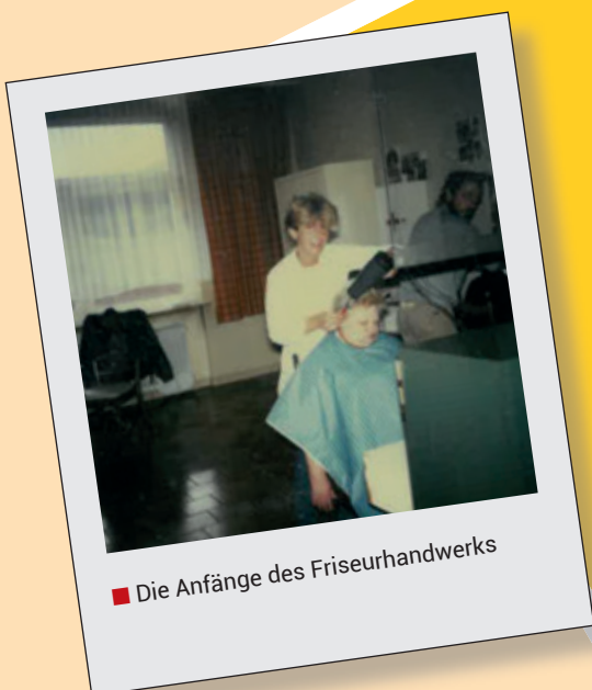
■ Die Anfänge des Friseurhandwerks