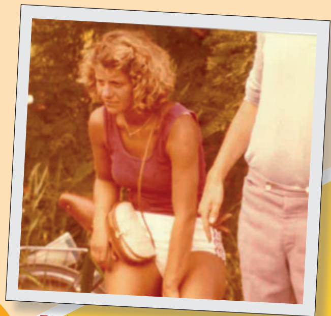
■ Ferienfreizeiten ...