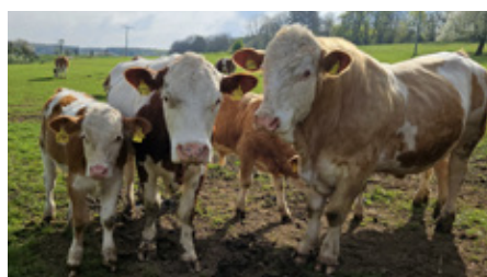
■ Vater, Mutter, Kind – Familienbild der Schottener Kühe.